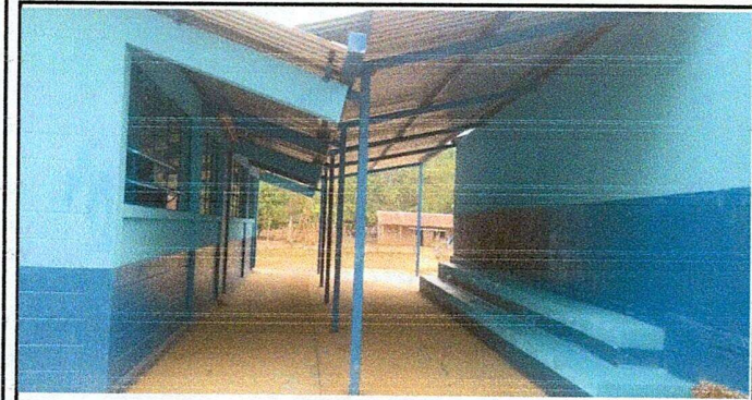
Foto1: Entechado del patio finalizado.